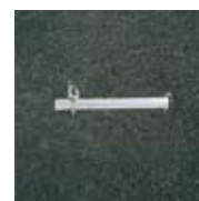
Kotva do zdi