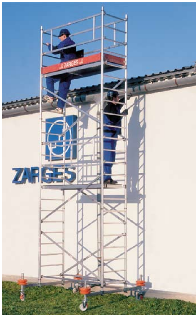
Lešení FAVORIT, modul A+B+C