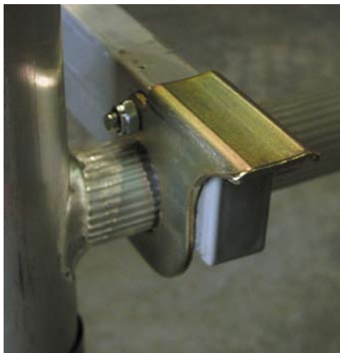
Propracovaný systém rychlouzávěrů a propojovacích objímek pro sestavení bez nářadí