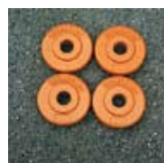
Závaží 10 kg